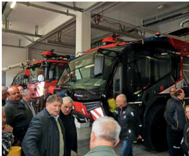
Glavni cilj izleta v neznano je bilo vojaško letališče v Cerkljah ob Krki.

Naš prvi postanek je bil namenjen kavici in odlični malici v Trebnjem. Pot smo nadaljevali proti osrednji točki naše ekskurzije, vojaškemu letališču Cerklje ob Krki. To letališče deluje v okviru Vojašnice Jerneja Molana, ki nosi ime po prvem padlem pripadniku TO v vojni za Slovenijo. Izvedeli smo veliko zanimivega o zgodovini omenjenega letališča in o pomembni vlogi, ki jo je imelo v času osamosvojitvene vojne. Ogledali smo si tudi nekaj letal in helikopterjev, ki jih uporablja Slovenska vojska, in z zanimanjem poslušali strokovnjake. Na letališču imajo tudi svojo gasilsko službo, ki so nam jo najprej predstavili v učilnici, nato pa so nam omogočili, da smo si nekatera gasilska vozila поблиže ogledali. Oboroženi z veliko novega znanja smo se poslovili od prijaznih vojakov in nadaljevali ekskurzijo. Odpeljali smo se v