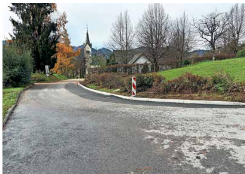
Cesto proti pokopališču so razširili.