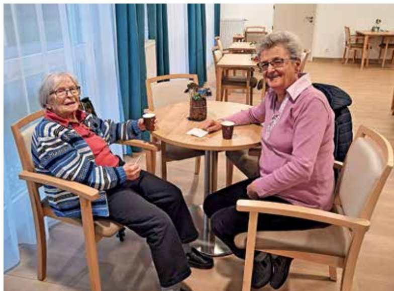
Družabniško prostovoljstvo v domu za starejše SeneCura Žiri

Prostovoljce smo za sodelovanje pridobili prek lokalnih društev in žirovske župnije, ki sicer že sodeluje z domom pri izvedbi nedeljskih maš. Mnogi prostovoljci tako združujejo obe obliki pro-