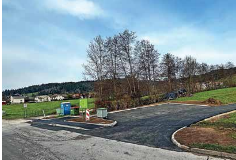
Na cesti Pod griči so uredili parkirišče za šest vozil.

Naslednja številka Žirovskih novic bo izšla 14. februarja 2025. Prispevke zanjo lahko pošljete do ponedeljka, 27. januarja 2025, na naslov mateja.rant@g-glas.si .