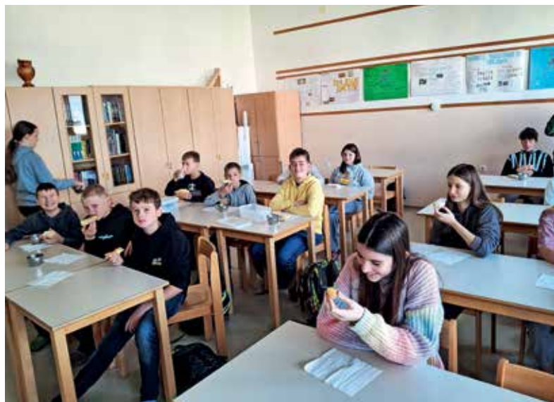
Učenci 8. c pri tradicionalnem slovenskem zajtrku

Tradicionalnemu slovenskemu zajtrku namenimo petek v tednu slovenske hrane, njegov namen pa je pomagati pri ozaveščanju in predajanju ključnih sporočil. Na ta dan otrokom in mladostnikom predstavimo pomen zdravih prehranjevalnih navad, zdravega načina življenja, trajnostnega prehranjevanja, zmanjšanja količine odpadne hrane, kulture prehranjevanja, pomena hrane iz naše bližine – lokalne hrane ter značilne tradicionalne jedi. Na žirovski osnovni šoli so imeli v petek, 15. novembra, na jedilniku za zajtrk mleko, maslo, med, jabolka ter kruh – živila, pridelana in predelana v bližnji okolici. Imeli so dovolj časa, da so kulturno pojedli in se pogovorili o pomenu zajtrka. Učenci so se pomerili tudi v kvizu. Odgovarjali so na vprašanja o tradicionalnem slovenskem