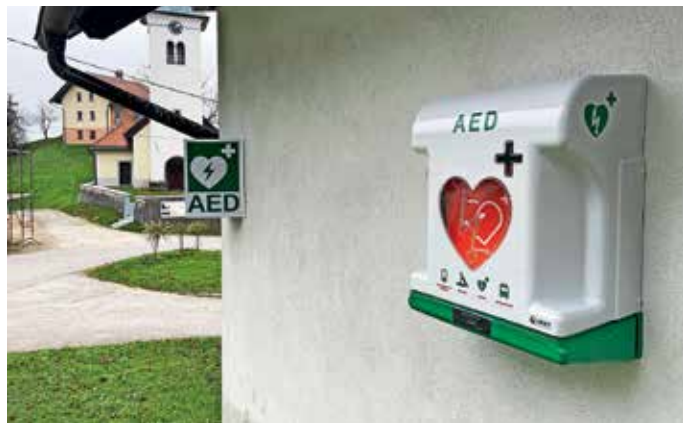
Novi defibrilator na Breznici

Društvo AED je neprofitna organizacija, ki deluje v javnem interesu na področju zdravstvenega varstva. Njihovo osnovno poslanstvo je širjenje mreže naprav AED po Sloveniji, zagotavljanje sredstev za vzdrževanje obstoječe mreže ter ozaveščanje laične javnosti o primernem ukrepanju v primeru srčnega zastoja. Doslej so financirali nakup že več kot 140 defibrilatorjev. Kot opozarjajo, je uporaba defibrilatorja v primeru, ko je treba reševati človeška življenja, preprosta in primerna tudi za laike. Za krajane Breznice pa so ob tem izvedli tudi izobraževanje s praktičnim prikazom uporabe defibrilatorja in temeljnih postopkov oživljanja.