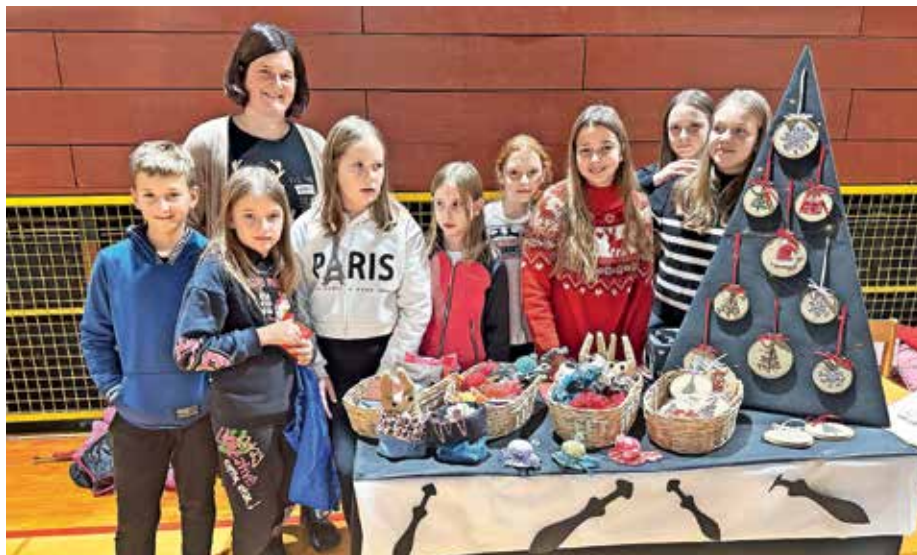
S svojimi izdelki so učenci čipkarske šole sodelovali tudi na Miklavževem sejmu v šoli.