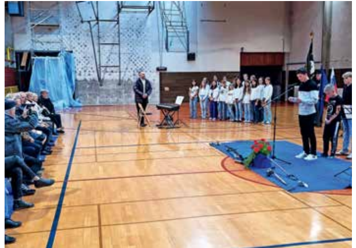
V Domoljubnem društvu general Rudolf Maister Žiri so v sodelovanju z Osnovno šolo Žiri zaznamovali letošnje Maistrovo leto in petletnico delovanja društva.