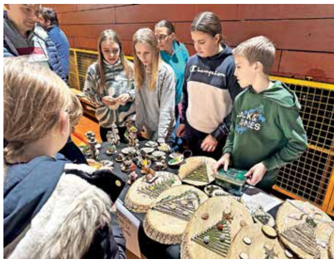
Za Miklavžev sejem so učenci s pomočjo učiteljev pripravili številne čudovite izdelke.

Obenem je bil sejem priložnost za druženje in sproščen pogovor. S prazničnim popoldnevom so ustvarili toplino decembra in priložnost na prihajajoče praznike.