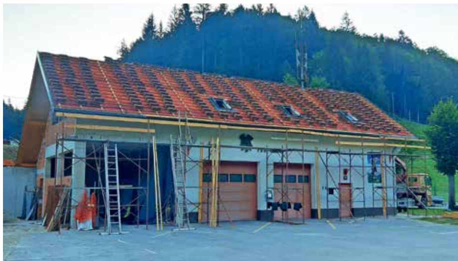
Spomladi se je začela gradnja prizidka h gasilskemu domu v Račevi.

Zato se je pred leti vodstvo društva odločilo zgraditi dodatne prostore in obnoviti notranjost gasilskega doma. Z gradnjo prizidka bomo v društvu pridobili skupno dodatnih 112 metrov prostorov: prostor za operativne dejavnosti, lažje in bolj ustrezno skladiščenje in vzdrževanje opreme in voznega parka. V zgornjem delu prizidka bo izgrajena večja dvorana, ki bo namenjena izobraževanju, usposabljanju, druženju, delu z mladino in za ostale družabne dogodke in prireditve, ki krepijo vezi med društvom in skupnostjo.