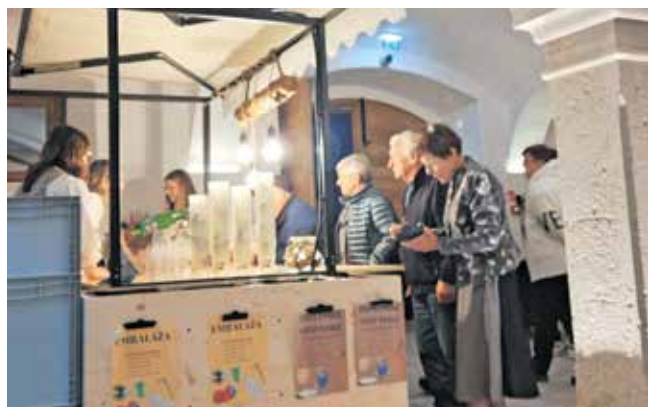
Z dogodka Oktoberfejt na Dvorcu Visoko

V okviru projekta, v izvedbi LAS loškega pogorja, Komunale Škofja Loka in Zavoda Poljanska dolina, sta slednja v izogib velikim količinam odpadkov na dogodkih nakupila skupno več kot 20.000 pralnih