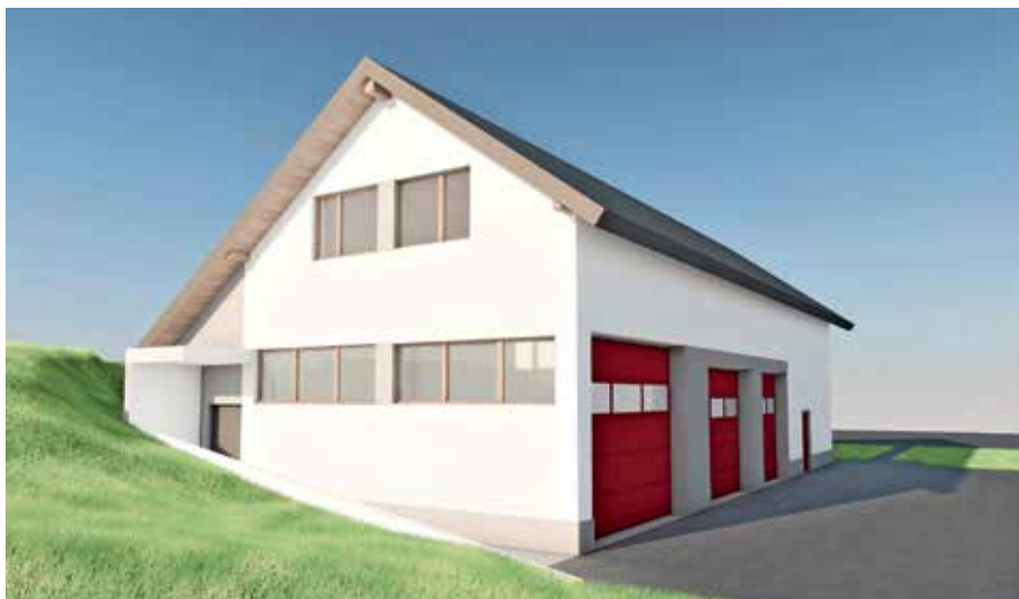
Vizualizacija novega prizidka

Vsi, ki želite prispevati k projektu – bodisi s finančno pomočjo, materialom ali prostovoljnim delom –, ste toplo vabljeni, da se obrnete na PGD Račeva. S prizidkom gasilskega doma gradimo več kot le stavbo – gradimo prihodnost našega društva in kraja. Hvala vsem, ki nam pri tem pomagate in nam še boste. Vsakega prispevka ali vašega obiska na dogodkih, ki jih organiziramo, smo zelo veseli.