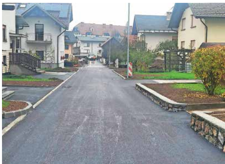
Obnovljena Dražgoška ulica