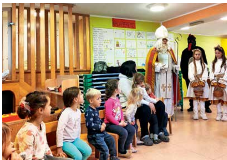
Najmlajše je z obiskom razveselil Miklavž.

S prvim decembrskim nastopom in tremi pesmicami so obogatili prižig prazničnih lučk v Žireh, z veseljem pa so prižgali tudi prvo svečko na adventnem venčku in s tem vstopili v adventni čas pričakovanja. V posebnem kotičku, ki je namenjen adventnemu venčku, se bodo decembra zbirali, pogovarjali o adventu, prižgali svečke, molili, peli pesmi, ob dramatizaciji vzgojiteljic spoznavali zgodbe iz knjige Medvedkova pot do Betlehema in odštevali dneve do Jezusovega rojstva. V adventnem času pa so in še bodo tudi ustvarjalni – starejši otroci v teh dneh z vso vnemo in spretnimi prsti ustvarjajo praznične voščilnice z motivom betlehemskega hlevčka, ki je ob straneh šivan. Iz vrtčevske kuhinje pa je zadišalo tudi po piškotih, s katerimi so razveselili Miklavža, ki je otrokom ob obisku prinesel nekaj lepih daril, jih pohvalil, poudaril njihove vrline in jih spomnil, naj še naprej sledijo njegovemu zgledu ter bodo dobri in prijazni drug do drugega.