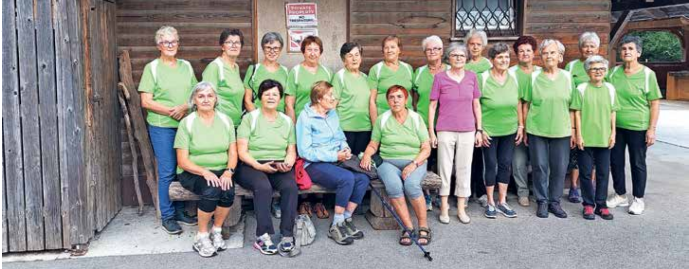
Vadba za invalide je tudi po petindvajsetih letih dobro obiskana.